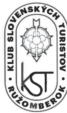
Znak - čiernobiele vyhotovenie