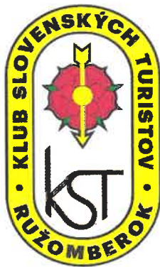
Znak - farebné vyhotovenie